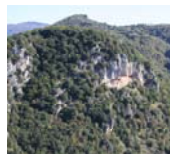
A timpa e Sassa

Itinerari sportivi (arrampicate, "Percorso Vita", Trekking, mountain bike)